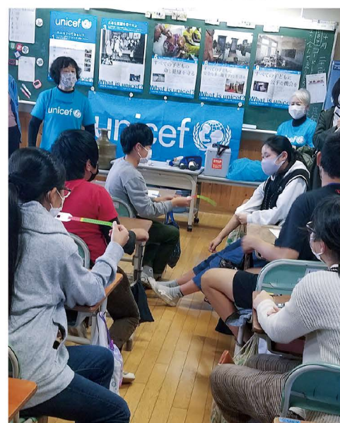
「命のメジャー」で上腕を測ってみましょう。