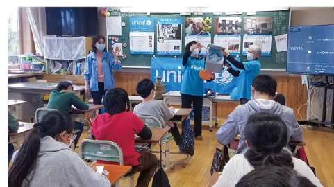
ユニセフの支援グッズを紹介しています。