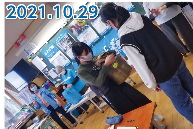
水がめを運ぶ体験