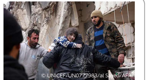
▲北西部にあるアレッポのアフリーンの農村部で、地震により倒壊した建物の瓦礫から小さな子どもを救助する地域住民たち。(シリア、2023年2月6日撮影/ AFP)

トルコ・シリア国境で発生した大規模地震により、数千人の死傷者が発生しています。被災地域では、多くの家屋が倒壊したほか、学校、病院、医療・教育施設が損害を受け、子どもたちにも大きな影響を及ぼしています。ユニセフはトルコ・シリアにおいて人道支援の準備を進めています。