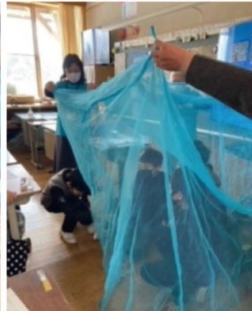
▲マラリア予防の蚊帳に入ってみましょう

岩手県ユニセフ協会では、世界の子もたちの状況やユニセフの支援について、映像や資料をまじえた出前講座を行っています。1月26日(木)、金ヶ崎国際交流協会様のご協力のもと、金ヶ崎町立永岡小学校(6年生19名)の出前講座に出かけました。5歳未満の死亡率の地図を見たり、水汲みのための水がめを持ってみたり、蚊帳に入ってみたりして世界の子もたちの状況を体験学習しました。