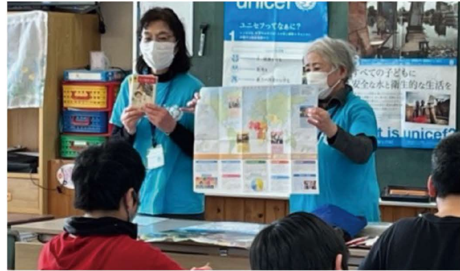
▲世界地図を見てください