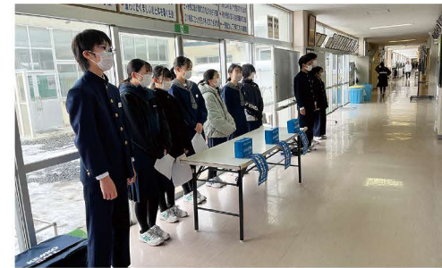
▲北上市立上野中学校の校内募金の様子