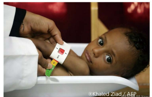
▲イエメン西部ホデイダで、治療を受ける栄養失調の子ども。(2022年2月15日撮影、資料写真)

声明では、紛争や気候変動、新型コロナウイルスの世界的な大流行や物価上昇により、深刻な栄養失調に陥る子どもが増えていると指摘しています。最悪の影響を受けている15カ国では、子ども3000万人以上が急性栄養失調に苦しんでいて、そのうち800万人は栄養失調の中で最も致命的な症状とされる重度の消耗症とのことです。15カ国とは、アフガニスタン、ブルキナファソ、チャド、コンゴ民主共和国、エチオピア、ハイチ、ケニア、マダガスカル、マリ、ニジェール、ナイジェリア、ソマリア、南スーダン、スーダン、イエメン。共同声明は、「深刻化する危機において、前例のないニーズに手遅れになる前に対応する」ための努力を支援するため、さらなる資金が必要だ」と訴えています。食料・栄養危機によって深刻な影響を受けている15カ国で、最も弱い立場にある子どもたちを守るために、ご協力をお願いします。