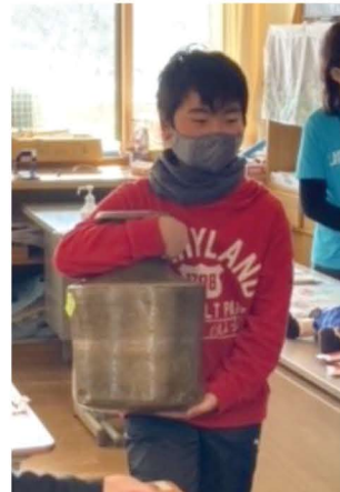
▲水がめを持ってみましょう