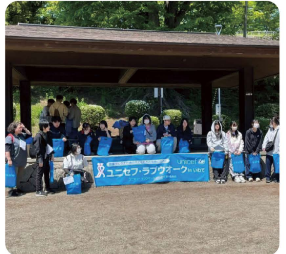
▲盛岡スコレ高校のみなさん