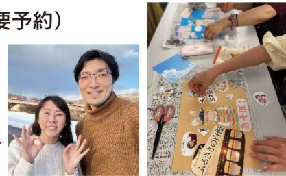
日協ご夫妻とアートコラージュの様子