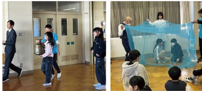
▲盛岡市立上田小学校での水がめ運びとマラリア予防蚊帳体験

世界の子どもたちの状況や課題をユニセフを通して学び、考えます。映像や資料を使い、体験コーナーもまじえてお話しします。国際理解の場としてご活用ください。時間・内容・対象などは相談して対応します。学習の時間や委員会活動、PTAや職場など、年齢や人数は問いません。(講師料は無料です)