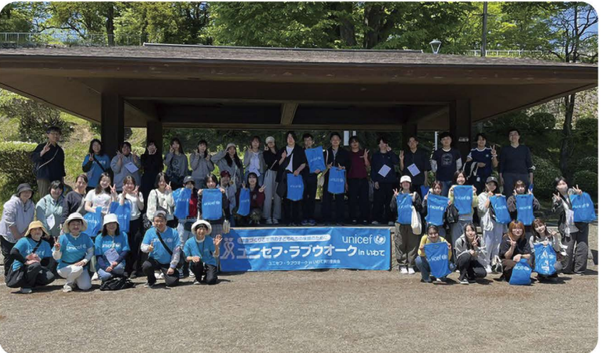
▲盛岡大学 学生委員会のみなさんとスタッフ