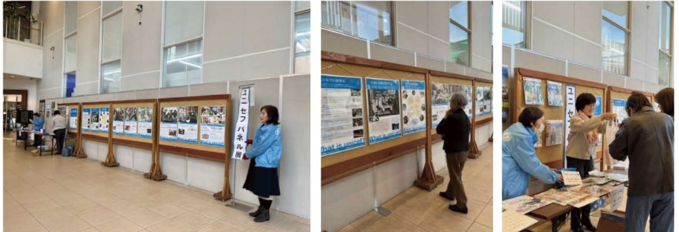
▲「ユニセフってなあに？」パネル展示 ▲「今年も楽しみに来ました」